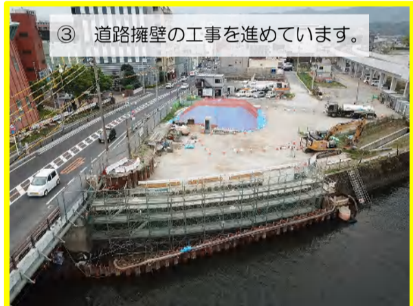
③ 道路擁壁の工事を進めています。