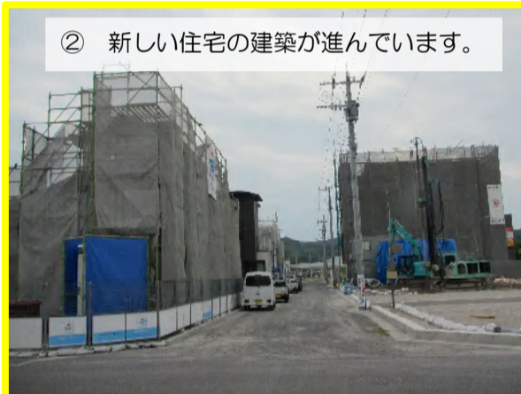
② 新しい住宅の建築が進んでいます。