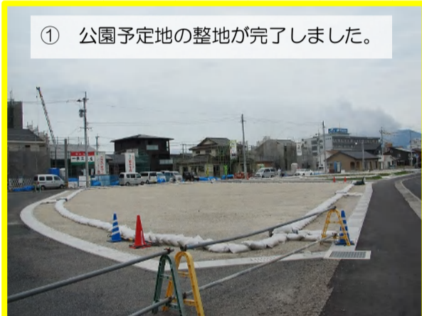
① 公園予定地の整地が完了しました。