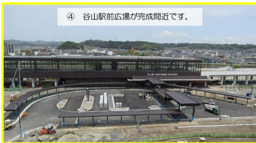
④ 谷山駅前広場が完成間近です。