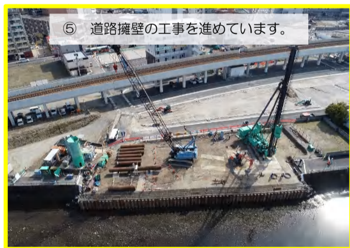
⑤ 道路擁壁の工事を進めています。