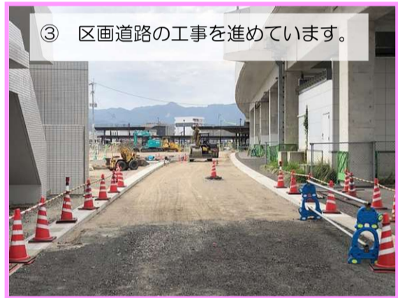
③ 区画道路の工事を進めています。