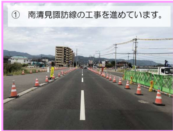
① 南清見諏訪線の工事を進めています。

南清見諏訪線が整備完了した後、辻之堂本城線を整備し、十字路の交差点となります。 (令和2年5月末完成予定)