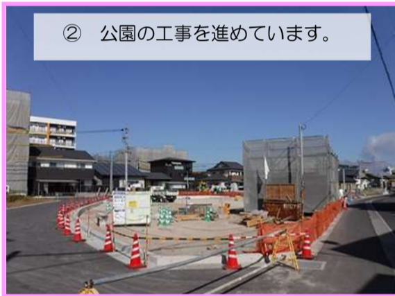
② 公園の工事を進めています。