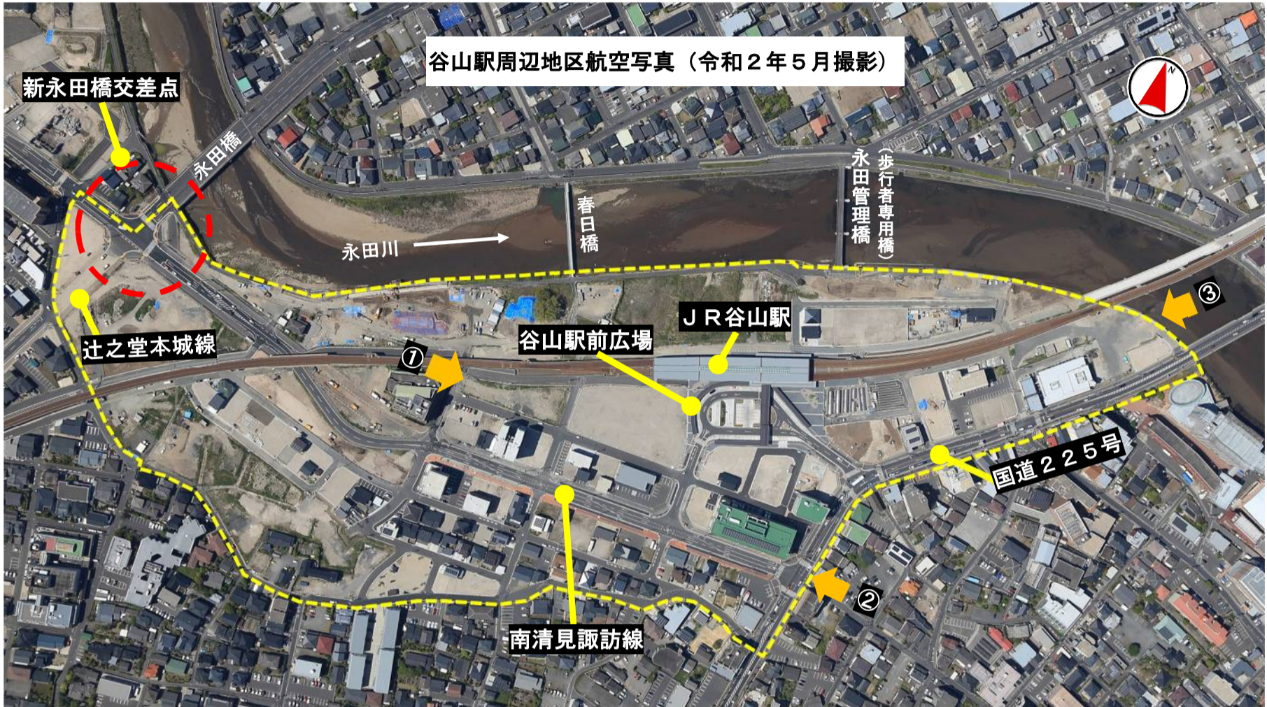
谷山駅周辺地区航空写真(令和2年5月撮影)