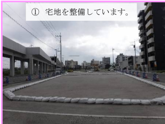
① 宅地を整備しています。