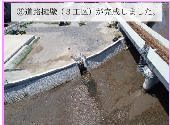
③ 道路擁壁(3工区)が完成しました。