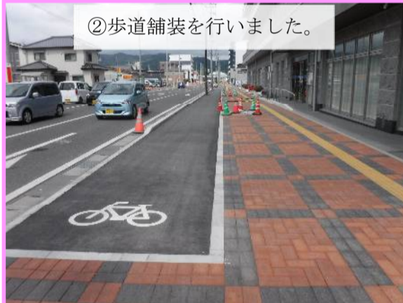
② 歩道舗装を行いました。