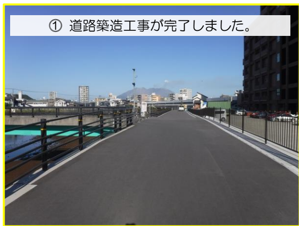
① 道路築造工事が完了しました。