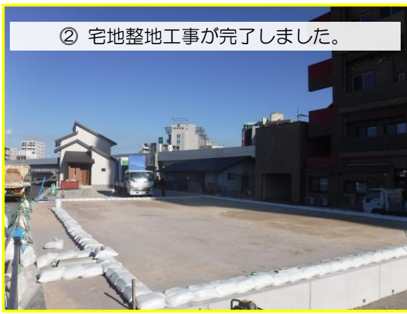
② 宅地整地工事が完了しました。