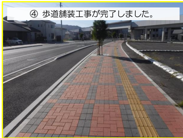
④ 歩道舗装工事が完了しました。