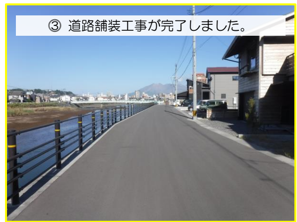
③ 道路舗装工事が完了しました。