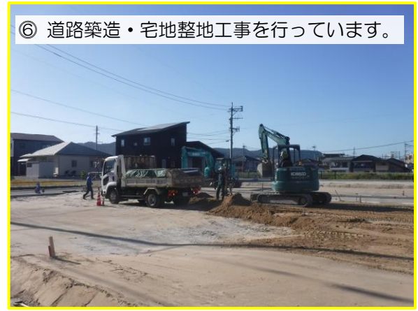
⑥ 道路築造・宅地整地工事をしています。