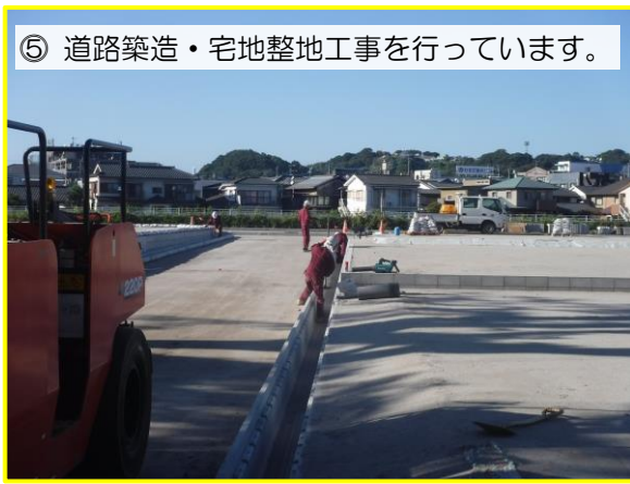
⑤ 道路築造・宅地整地工事をしています。