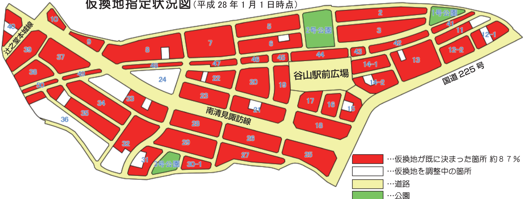
仮換地指定状況図(平成28年1月1日時点)

厳しい寒さが続きますが、皆様が、今年度も皆様のご理解とご協力をいただきながら、仮換地(区画整理後の土地)に関する協議や、建物移転に関する協議を進めております。 仮換地指定率は85%を超え、建物の移転も各所で進んでおります。また、幹線道路「南清見諏訪線」や、その周辺の区画道路の工事も進めております。工事期間中は、ご迷惑をおかけしておりますが、ご理解とご協力をよろしくお願いいたします。 今後も、建物の移転や道路工事などをおこなうとともに、電気、水道などのライフラインの整備も進め、住宅建築などの使用収益を進めていきます。 周辺の方々には大変ご迷惑をおかけしますが、事業の早期完了に向け、より一層、努力してまいりますので、引き続きご協力よろしくお願いいたします。