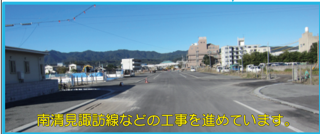
南清見諏訪線などの工事を進めています。