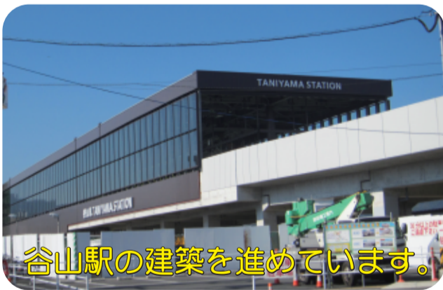
谷山駅の建築を進めています。

厳しい寒さが続きますが、皆様が、今年度も皆様のご理解とご協力をいただきながら、仮換地(区画整理後の土地)に関する協議や、建物移転に関する協議を進めております。 仮換地指定率は85%を超え、建物の移転も各所で進んでおります。また、幹線道路「南清見諏訪線」や、その周辺の区画道路の工事も進めております。工事期間中は、ご迷惑をおかけしておりますが、ご理解とご協力をよろしくお願いいたします。 今後も、建物の移転や道路工事などをおこなうとともに、電気、水道などのライフラインの整備も進め、住宅建築などの使用収益を進めていきます。 周辺の方々には大変ご迷惑をおかけしますが、事業の早期完了に向け、より一層、努力してまいりますので、引き続きご協力よろしくお願いいたします。