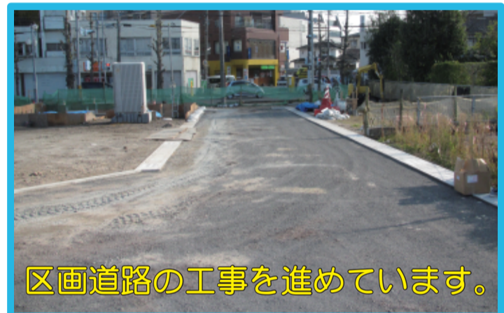
区画道路の工事を進めています。