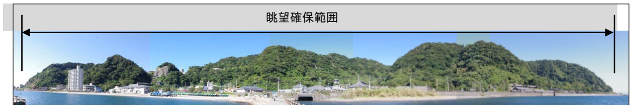
▲ 眺望地点2(突堤)から望む磯地区 2013年(平成25年)

(繁) 《薩摩沿革地圖》是昭和初期對以前的老地圖的再版。圖中山上的松樹和櫻花引人注目，特別是沿海一帶的櫻花樹林立，被稱為櫻谷一帶的櫻花尤其特色。