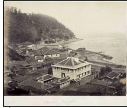
▲1874年(明治7年)。 長崎大学附属図書館所蔵。