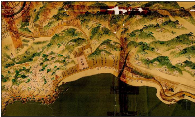
藩政時代の磯地区「鹿児島絵図(部分)」

(繁) 為了確保從錦江灣欣賞到本地區的景致，我們把能遠眺此地區的防波堤設定為眺望點。