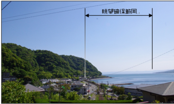
▲眺望地点1(鳥越)から望む磯地区 2013年(平成25年)。