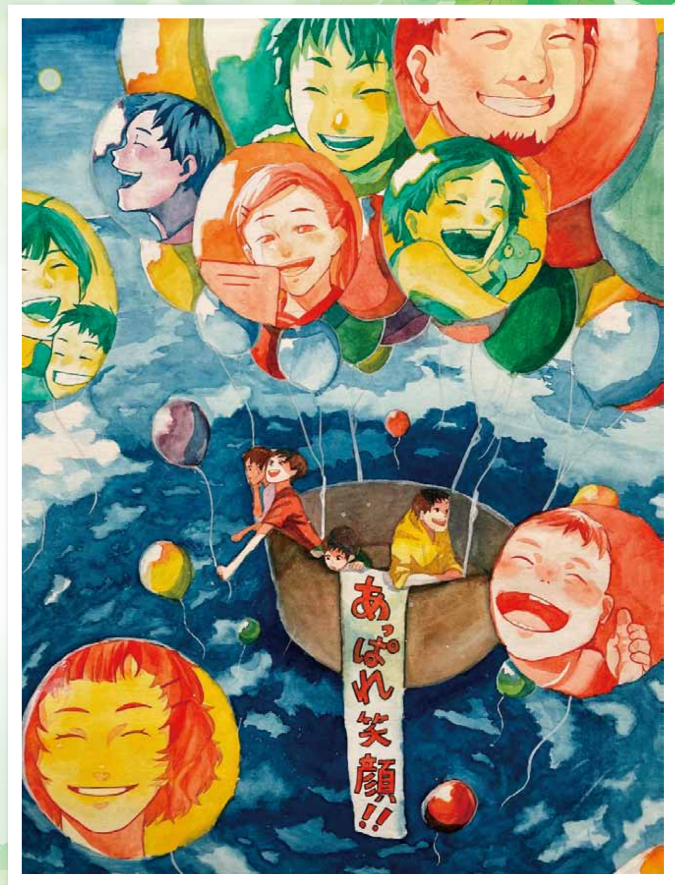
令和3年度「ニコニコ月間作品コンクール」吉野東中 3年 松永 葉奈