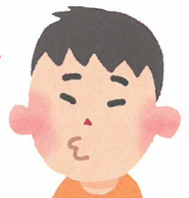
知らない人からのメール