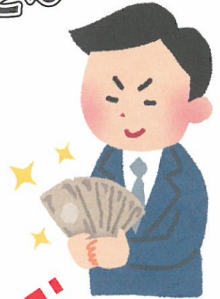
不当請求 高額請求