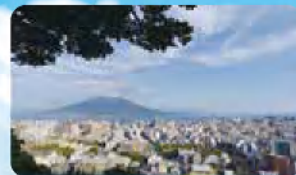
展望台からの眺め