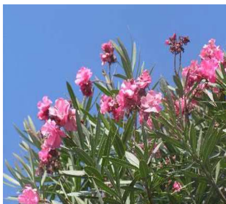
市の花 きょうちくとう